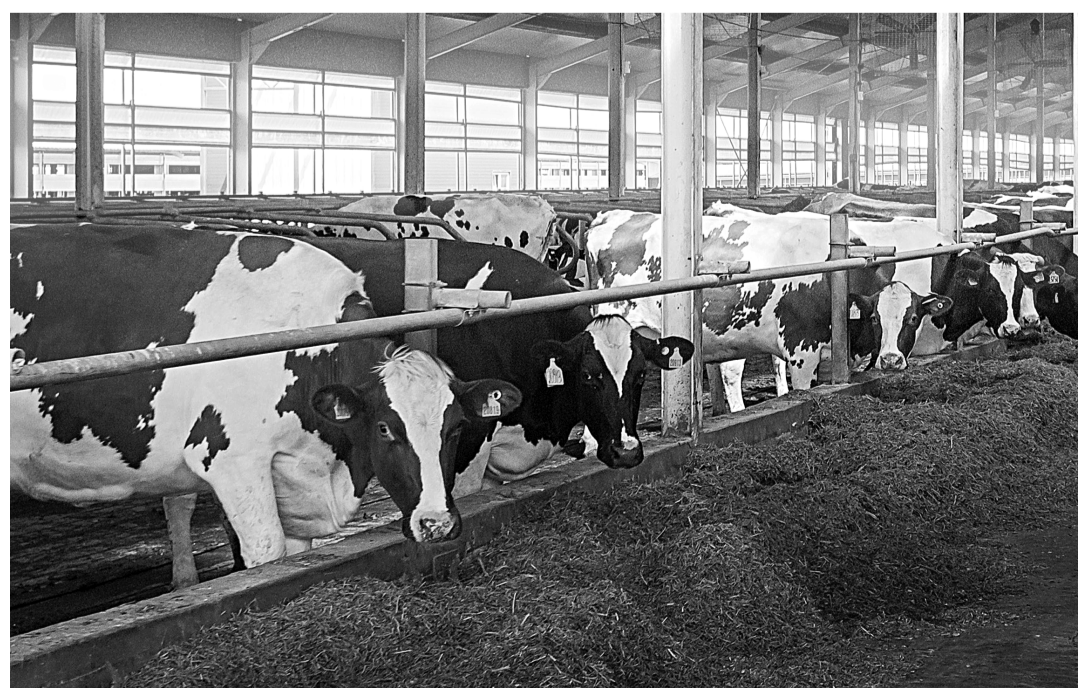
«Русмолко» увеличит дойное стадо на мегаферме в селе Аршиновка.